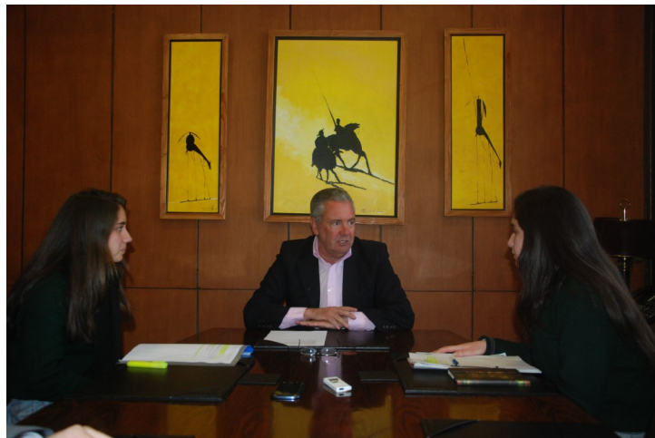
ENTREVISTA REALIZADA EN OFICINA DE ALCALDE

En cantidad de personas que se atienden yo diría que 60% niños y jóvenes y 40% adultos, aunque en realidad las actividades pueden ser para todos, son de carácter familiar, ese es el tinte que le damos, buscando la hora y el día, y que sean cosas que puedan ir todos, que no tenga la chiva el papá que está cansado y entonces la hacemos el sábado o el domingo, acabamos de tener, a todo esto, el campeonato de atletismo escolar, la final fue el domingo pasado, más de mil participantes de todos los colegios de Santiago, 32 colegios y los papás y los abuelos iban, todos pueden ir y se pasa